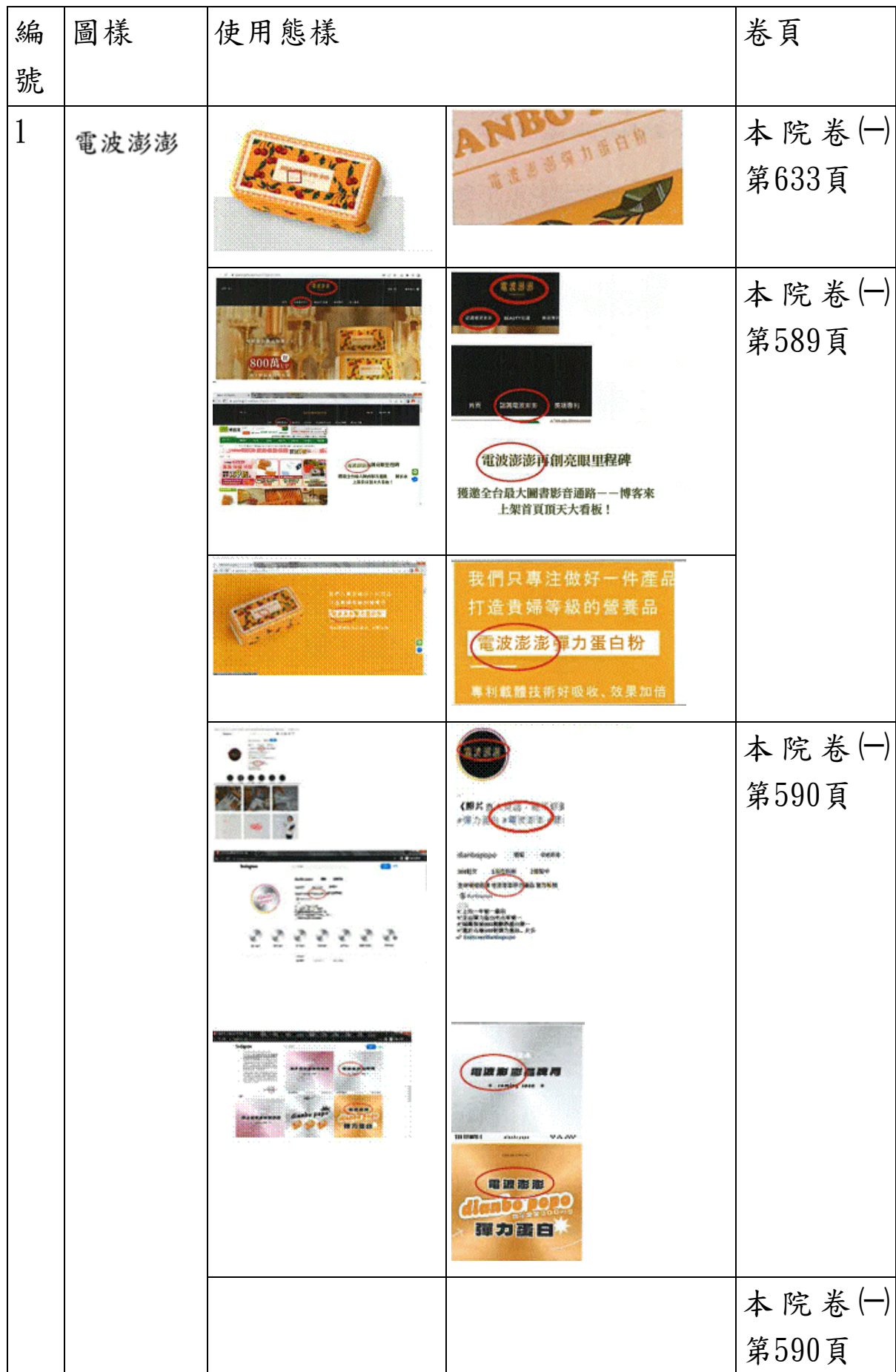
01 附表二：原告主張被告國民美少女公司、電波澎澎公司使用電波 02 澎澎商標態樣 03