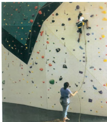
23 【照片一】 24

20 2. 經查，人工攀岩場之攀岩活動既有之傳統人力確保，由 21 雙人一組進行攀岩活動，分別為實際攀爬的攀岩者和確 22 保安全的確保員，如照片一所示。