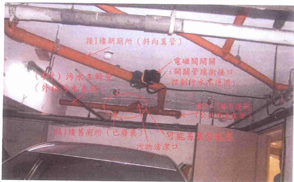
圖一 舊、新廁所(糞管)及污水主幹管現況平面