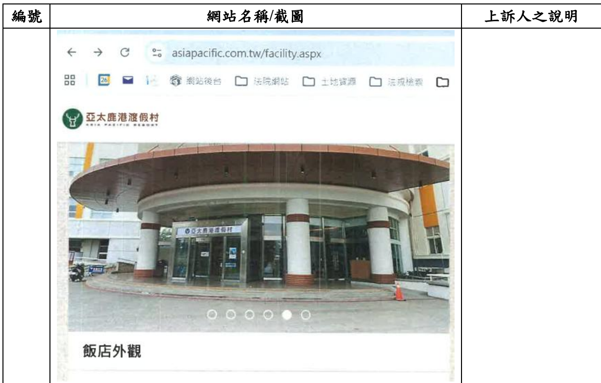
附圖 3-2 (上訴人所提之甲附圖 1，本院卷一第 205 頁)