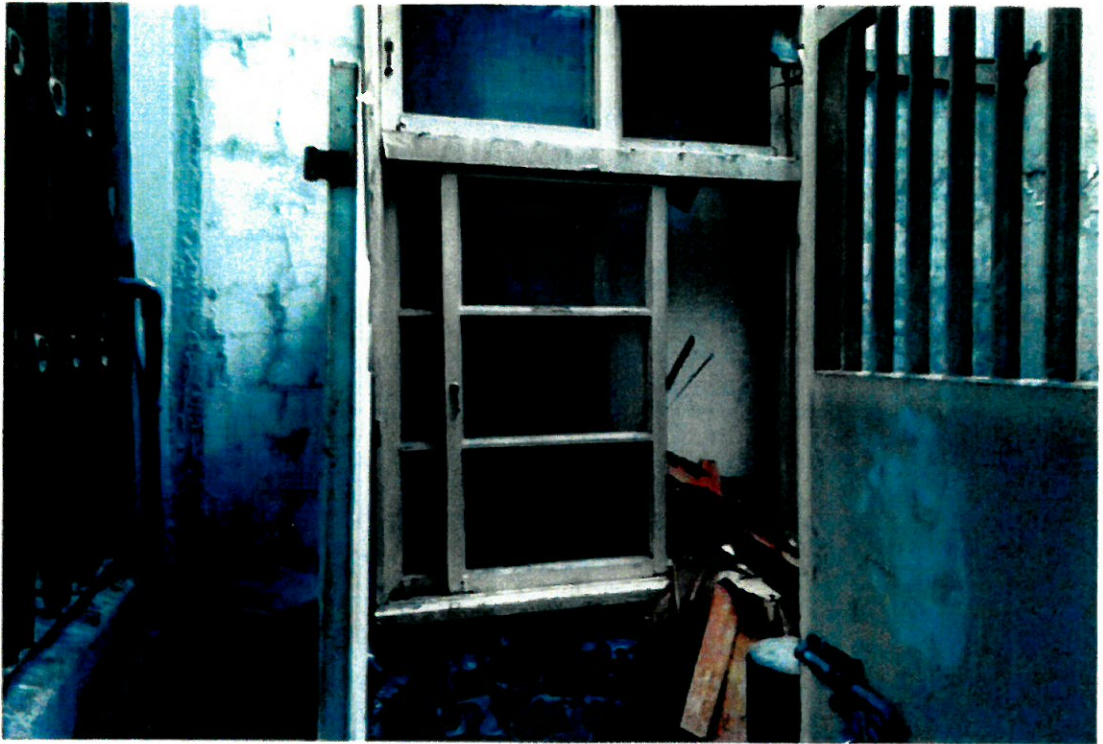
現場照片編號： ⑧ (105 號 3 樓窗戶由前至後排序 6 )